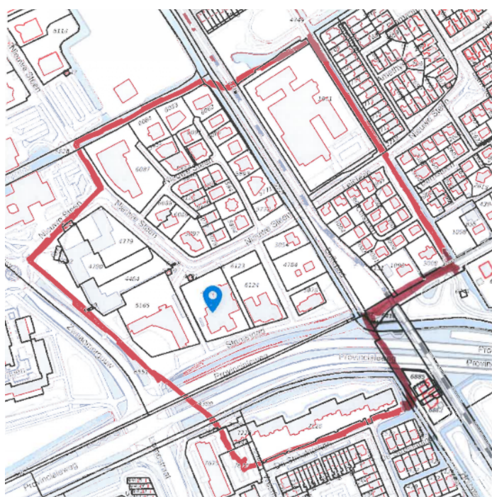
*Het gebied waar de uitnodiging is verspreid voor de inloopbijeenkomst 15 november 2022.

Dinsdag 15 november 2022 hebben A-Zeven projectontwikkeling en De Selectie omwonenden uitgenodigd voor de tweede bijeenkomst over de toekomst van het gebouw aan de Nieuwe Steen 6. In overleg met gemeente Hoorn is het spreidingsgebied bepaald en ruim 300 huishoudens en bedrijven zijn uitgenodigd, waaronder de ontwikkelaar van de Nieuwe Steen 8 (Octant) en de Nieuwe Steen 10. De uitnodigingen zijn op donderdagochtend 3 november verspreid. De inloopbijeenkomst vond plaats in de Copernicusschool en is als voortzetting op de eerder gevoerde gesprekken en bijeenkomsten georganiseerd.