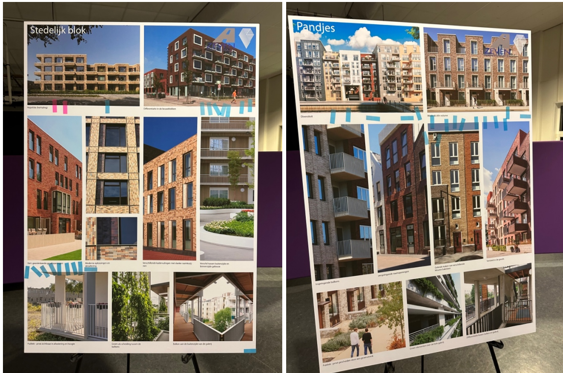
*De 2 ontwerpen (Stedelijk blok & Pandjes) met verschillende uitstralingen waar deelnemers op konden stemmen doormiddel van het plakken van stickers.

Daarnaast is er ook naar de mening gevraagd van omwonenden over de uitstraling die momenteel wordt overwogen om toe te passen voor het gebouw. Omwonenden konden dit kenbaar maken door een sticker te plakken bij het ontwerp welke hen voorkeur had.